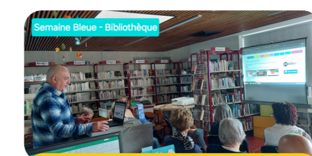
Bibliothèque : intervention de M. Pascal Manzon sur la sécurité des sites informatiques

L'édition 2024 a été particulièrement réussie avec la participation de plus de 110 séniors. Organisées par le C.C.A.S., différentes activités ont été proposées.