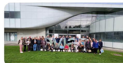
Euian : visite des sites emblématiques d'Euian, l'usine de production de l'eau d'Euian