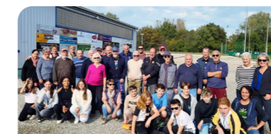
Pétanque : un bel après-midi intergénérationnel organisé par le club de Pétanque