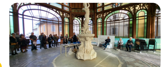
La buvette cachot