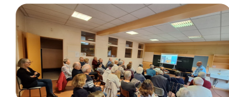
Gendarmerie : une conférence très intéressante sur les sujets de sécurité au quotidien, ciblée sur la sécurité numérique, présentée par le maréchal des logis-chef Toulouse.