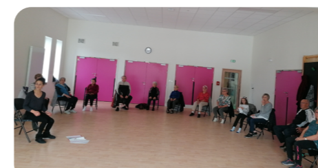
Yoga chaise : cette animation proposée par l'AGV a séduit les participants.