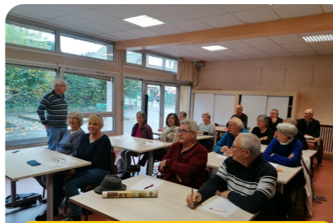
Certificat d'études : Un ancien enseignant a fait passer le certificat d'études, dictée et calcul/problème mental. Tous les élèves ont réussi et reçu un diplôme.