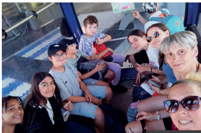
PROMENADE AU SEMNOZ