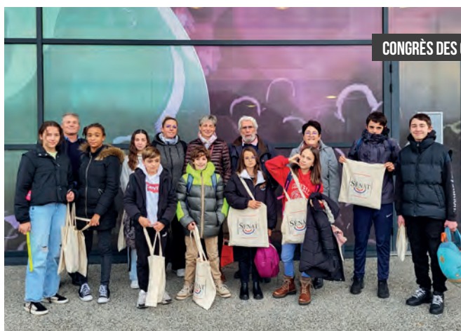
CONGRÈS DES CMJ