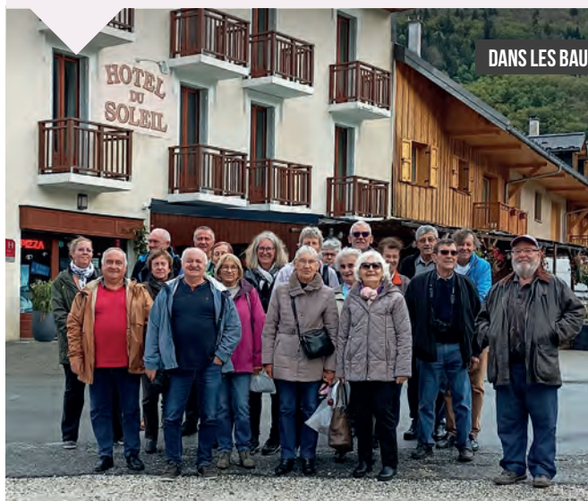
DANS LES BAUGES