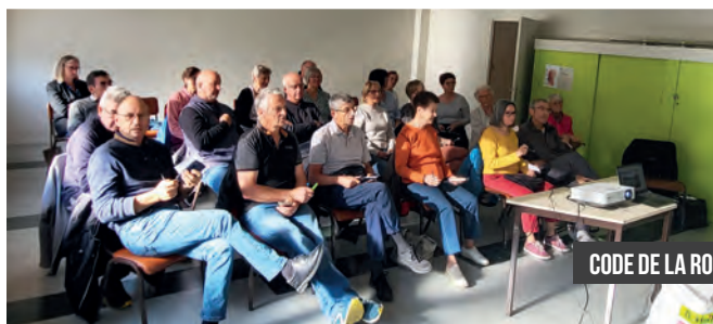
CODE DE LA ROUTE