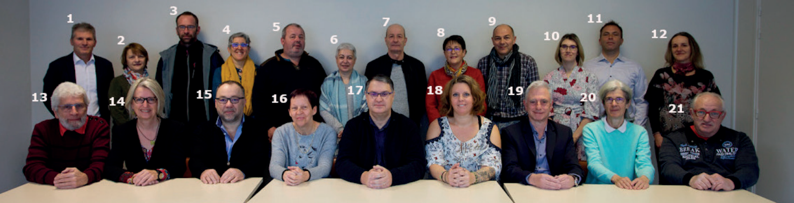
22 février 2020