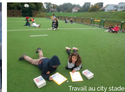
Travail au city stade