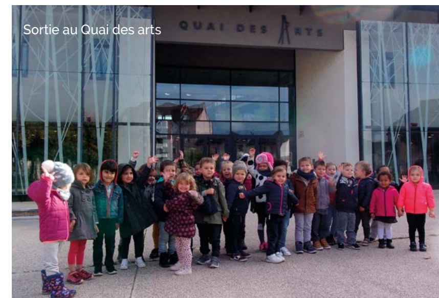
Sortie au Quai des arts