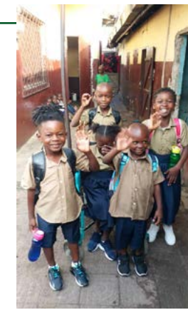
Enfants de l'orphelinat de Brazzaville en route pour l'école

Au Congo-Brazzaville, le dossier administratif concernant la réhabilitation d'un orphelinat est en cours et les travaux devraient débuter dans les semaines à venir.