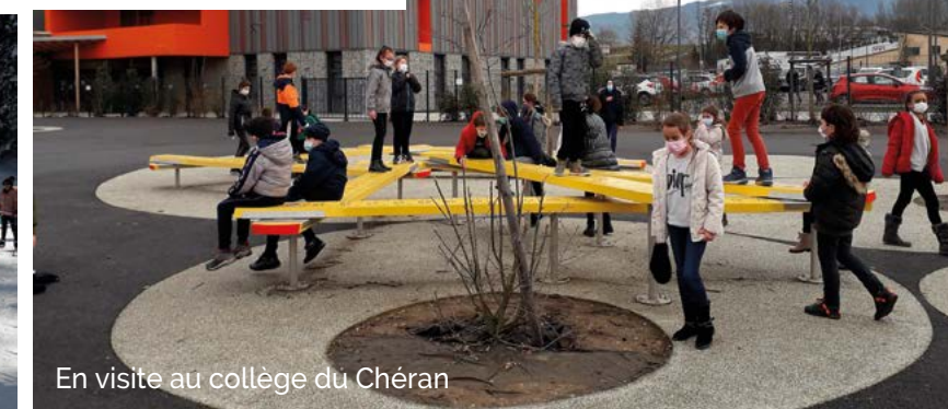
En visite au collège du Chéran