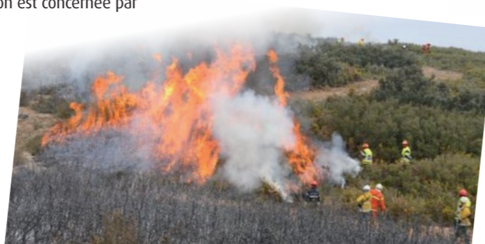
Brûlage effectué par des collectivités